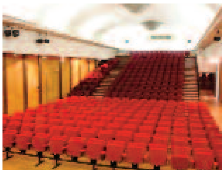
La salle Rossini