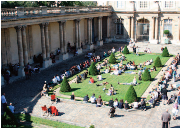
10 ème anniversaire du Festival Européen Jeunes Talents, le 14 juillet 2010