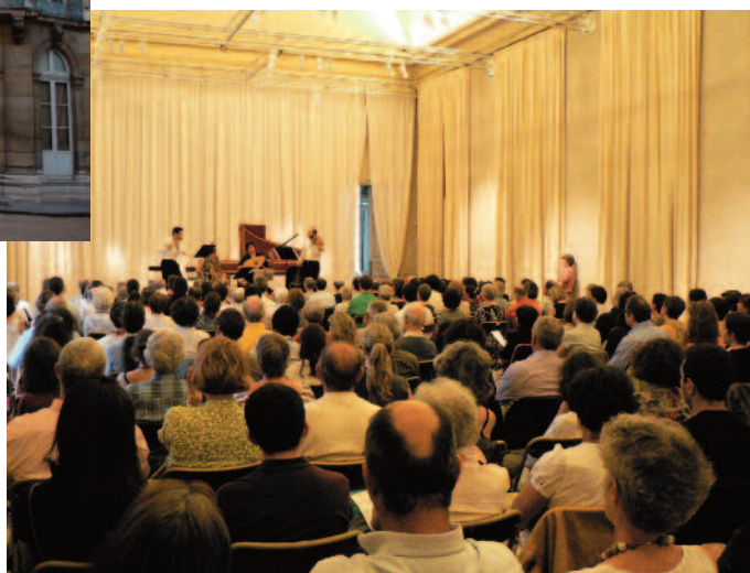
Concert de l'Ensemble Les Ombres, le 21 juillet 2010 dans la salle des Gardes

Le « Concert de Maître » et le « Compositeur Invité », deux nouveautés 2009 sont devenues traditions en 2010 :