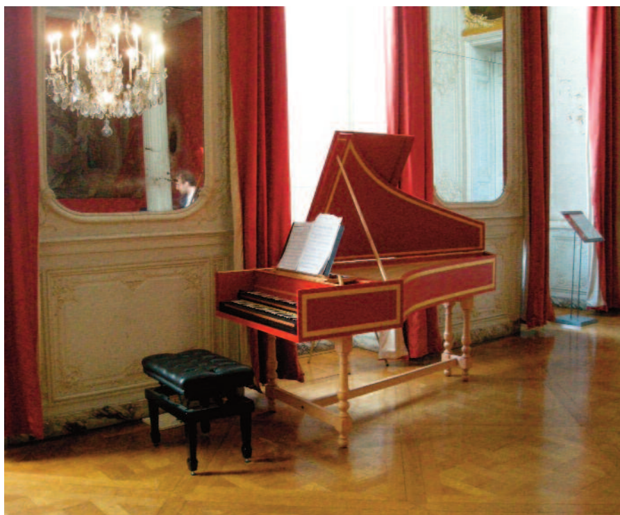
La Chambre du Prince de l'Hôtel de Soubise (1735)