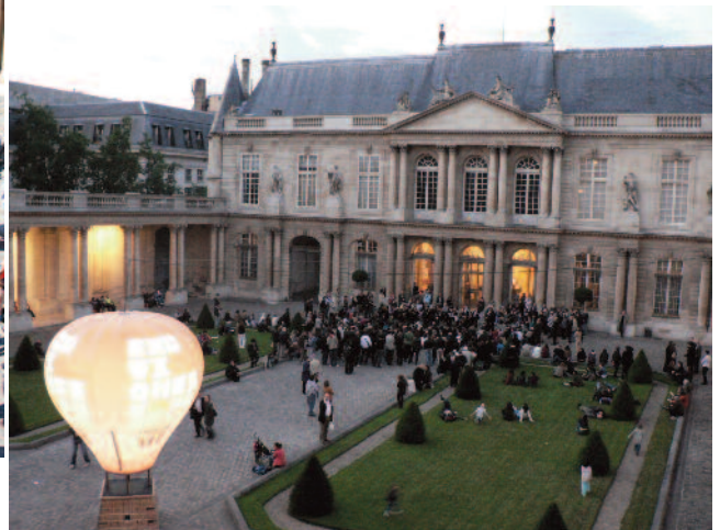
Fête de la Musique 2010