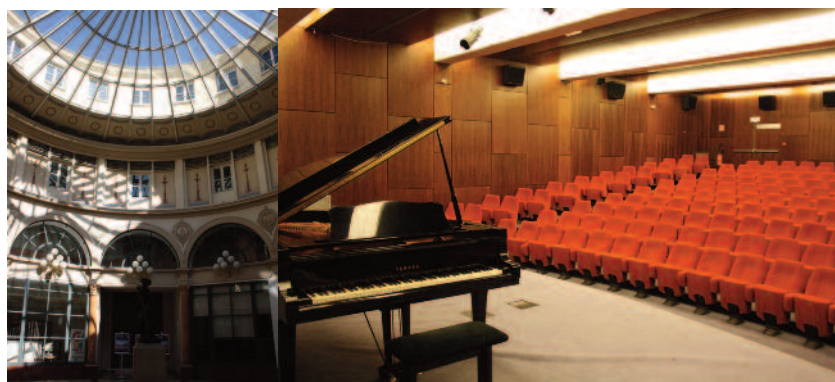
Galerie Colbert de l'INHA (1825)