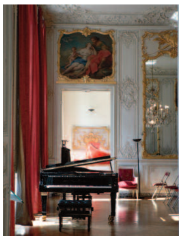
La Chambre du Prince de l'Hôtel de Soubise (1735)