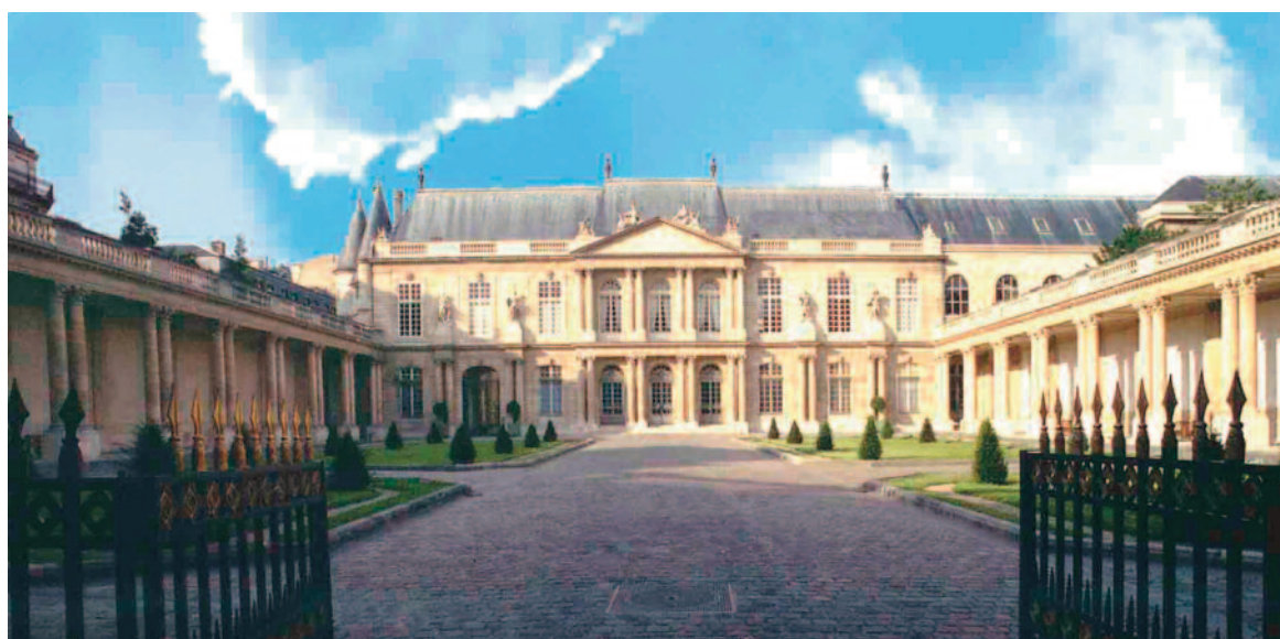
Cour et façade de l'Hôtel de Soubise (1705)

Coup d'essai réussi, qui a conduit Jeunes Talents et les Archives nationales à renouveler et développer l'expérience : les concerts du samedi ont commencé en septembre 2000, un samedi sur deux seulement pendant les deux premières saisons, puis un concert hebdomadaire de septembre à juin.