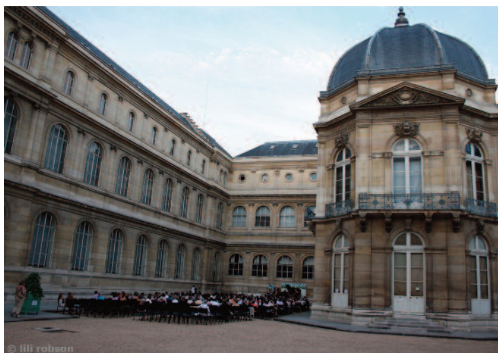
Concert de Varduhi Yeritsyan et du Quatuor Tenvea, le 20 juillet 2010 dans la Cour de Guise

La 10 ème édition s'est déroulée du 9 au 29 juillet 2010, une fois encore dans le cadre somptueux de l'Hôtel de Soubise - Archives nationales qui se prête idéalement à la musique de chambre : dans la Cour de Guise (cour intérieure) ou, par mauvais temps, dans la Salle des Gardes (située au 1 er étage de l'Hôtel de Soubise).